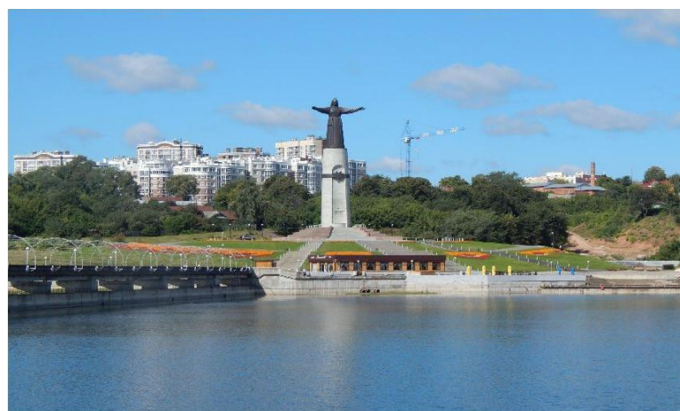
Монумент "Мать-Покровительница чувашского народа"